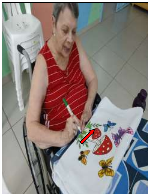
17.04-Pinturas com capricho