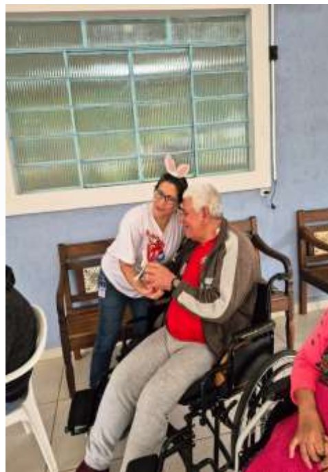
30.03-Páscoa com dignidade