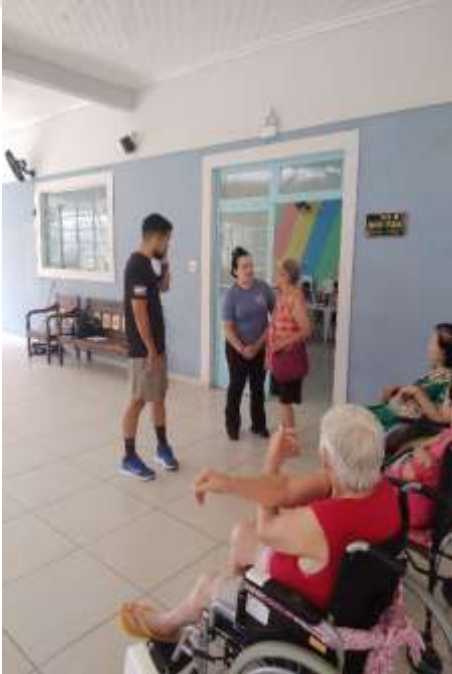
05.03-Estimulando a participação