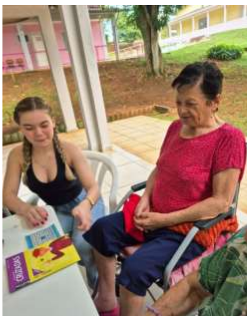
17.03-Ajuda para jogar