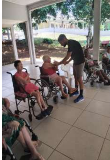
05.03-Ensinando a fazer o exercício