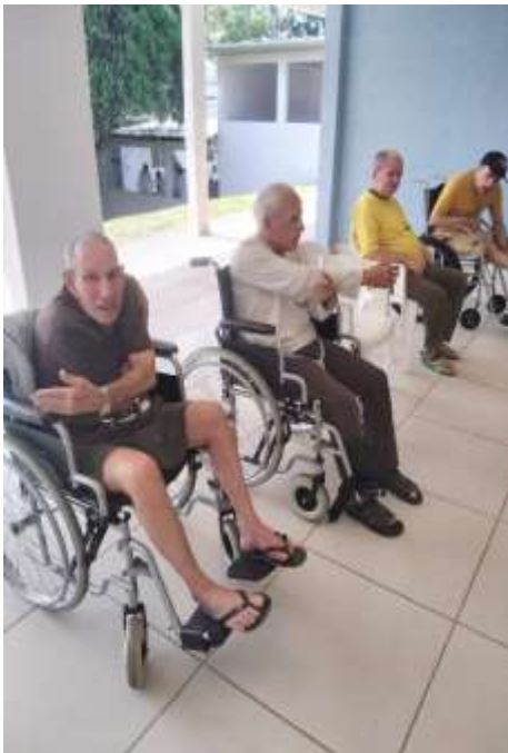
05.03-Atividade que faz bem