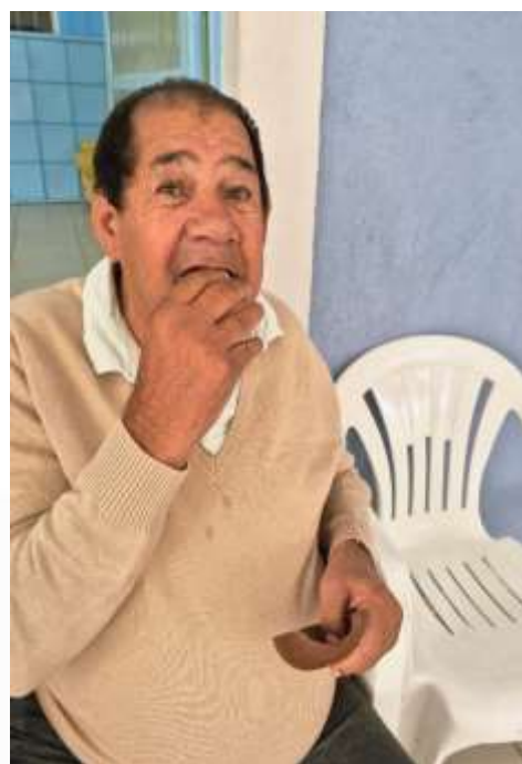
30.03-Hummm, tá bom!