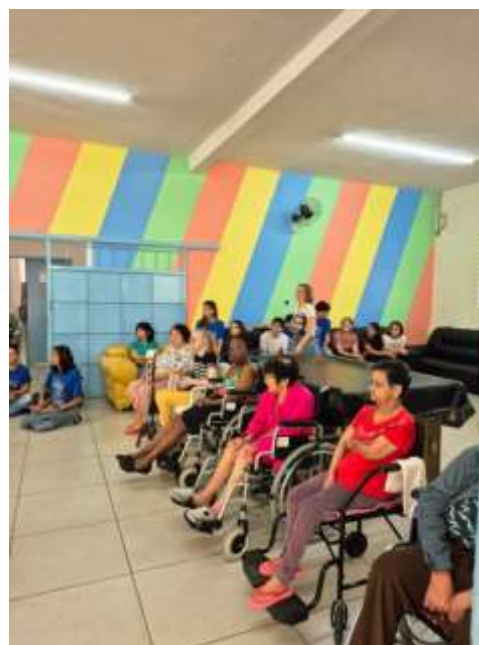
14.03-Gerações se encontram!