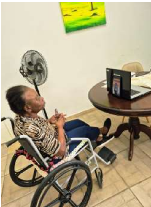
10.03-Conversando com o filho