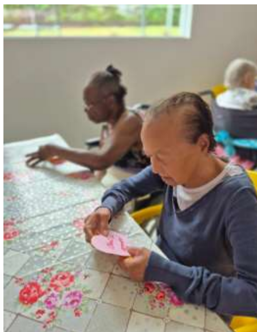
09.03-Homenagem carinhosa que fez a diferença!!!