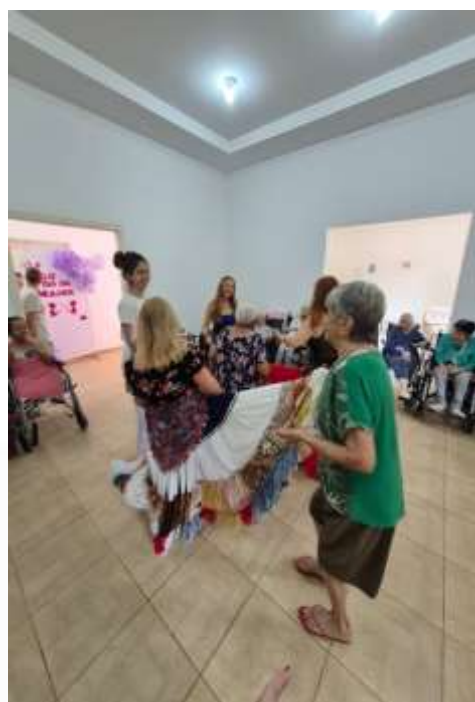
09.03-Idosa interagido com dançarina