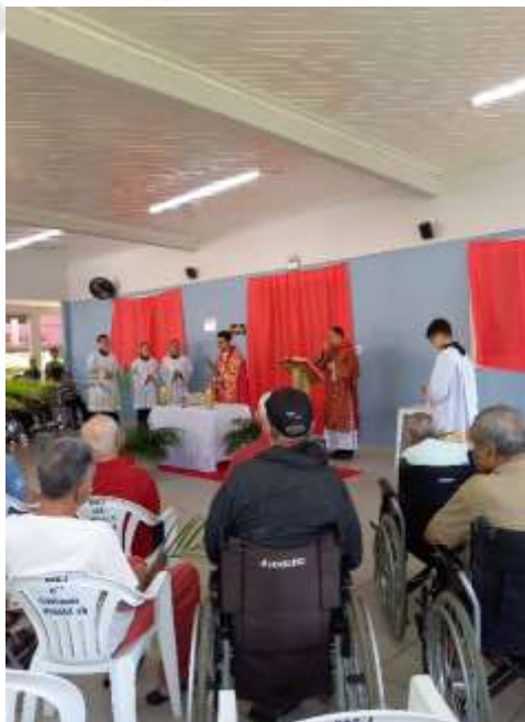
29.03-Início do rito do domingo de ramos