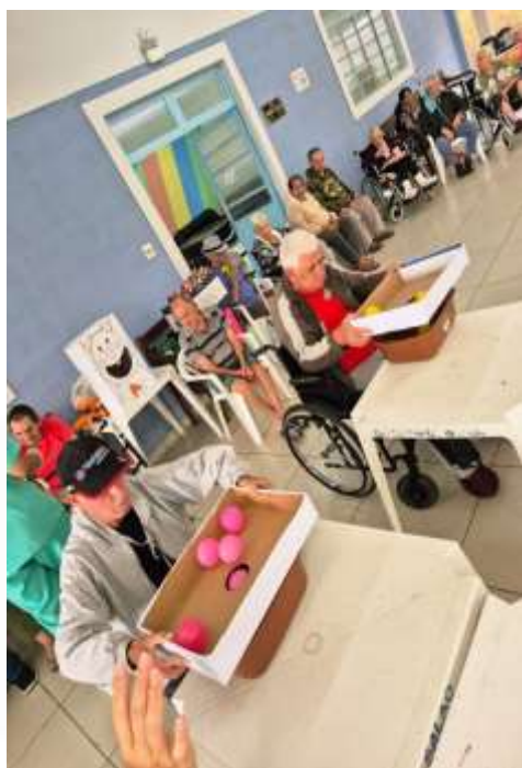
31.03-Acerte a boca do coelho