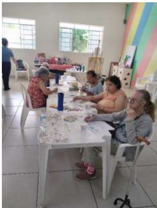
05.03-Idosas na oficina