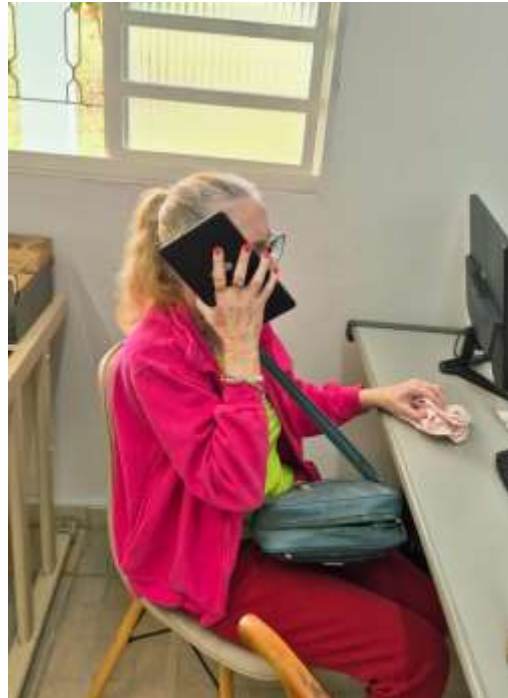
10.03- Telefonando para a amiga