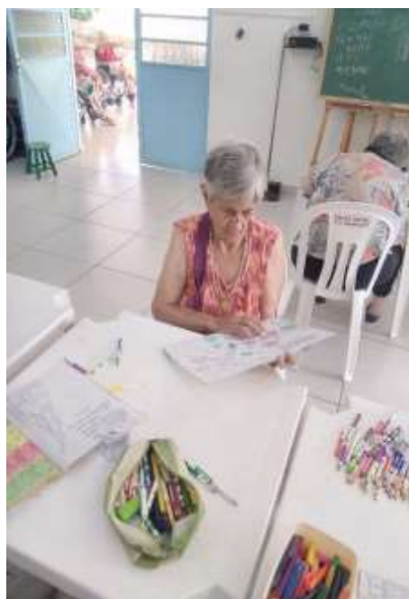
05.03-Concentração e capricho