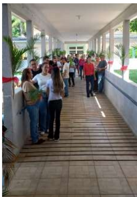
29.03-Integração com a comunidade local