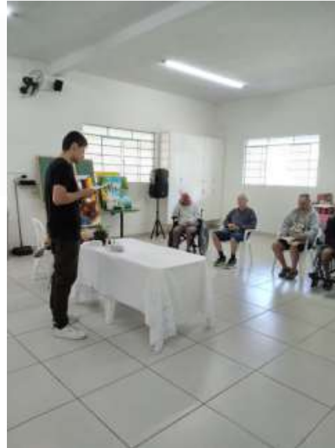
14.03-Palavras que edificam