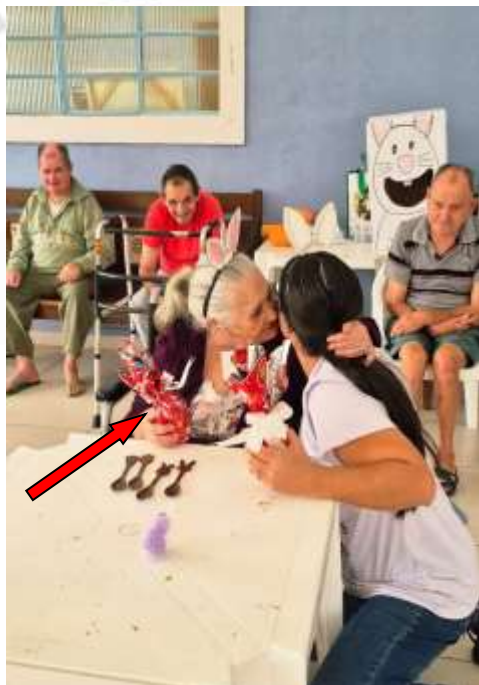
30.03-Comemorações tradicionais que alegam