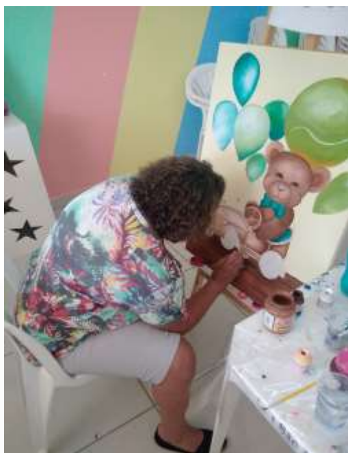
05.03-Detalhes que fazem a diferença!