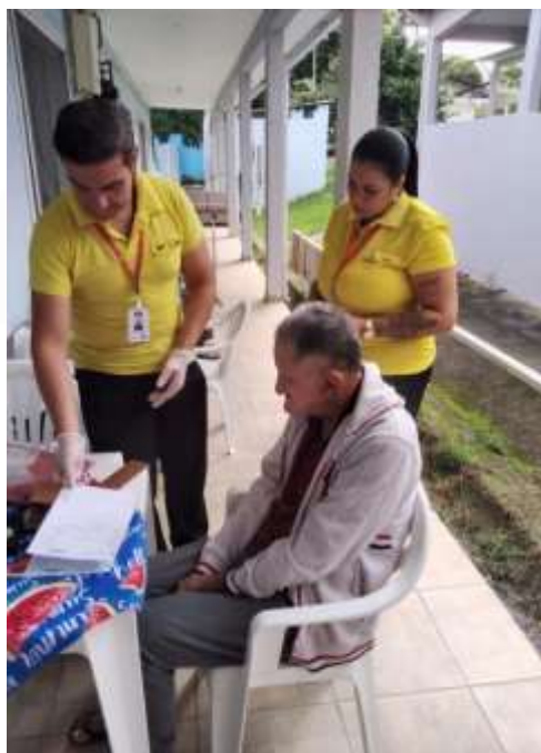
14.03-Informando sobre o atendimento