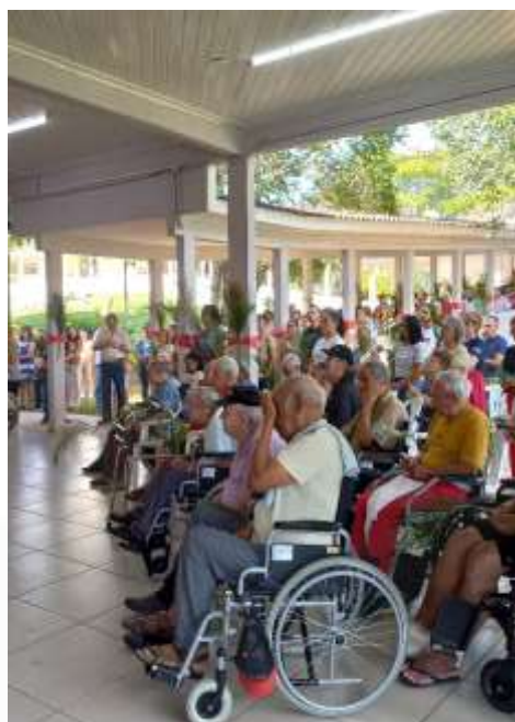
29.03- Religiosidade e interação