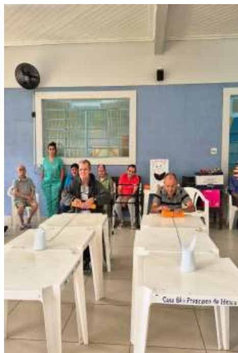
31.03-Corrida do coelho