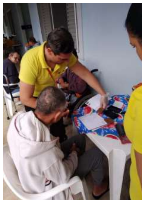
14.03-Cadastro das digitais