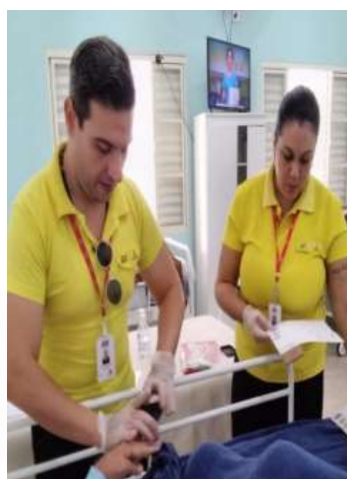
14.03-Atendimento no leito