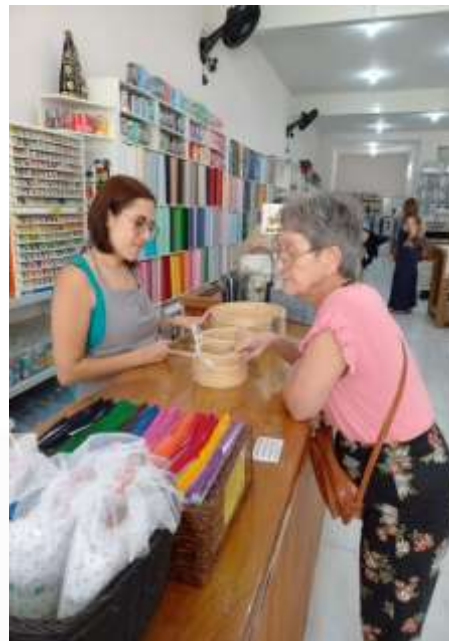
04.03-Passatempo: material para bordar