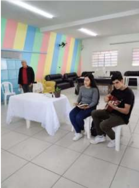
14.03-Canto para louvar o Senhor