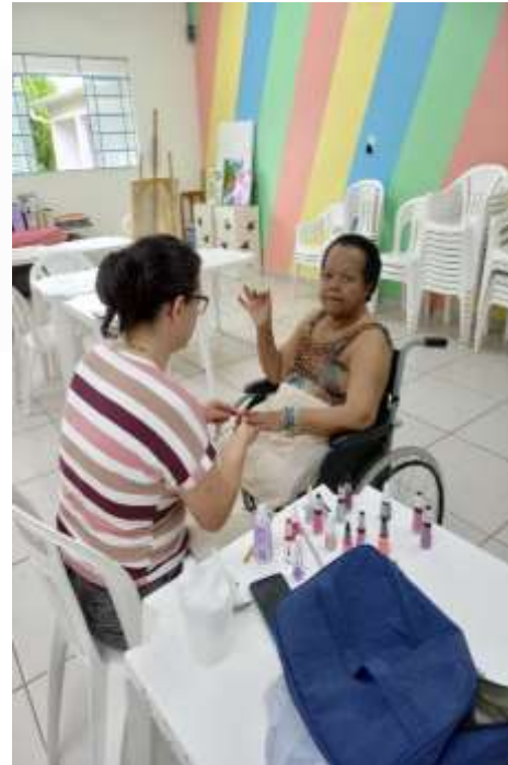
06.03-Auto estima e motivação