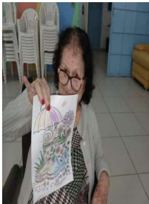
10.04-Sempre se esforçando e se superando!