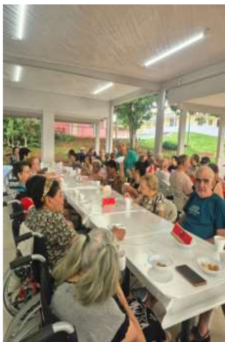
25.02-Festas que alegram!