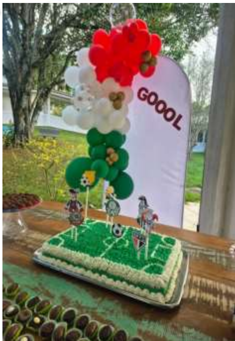
25.03- Decoração sugestiva: futebol