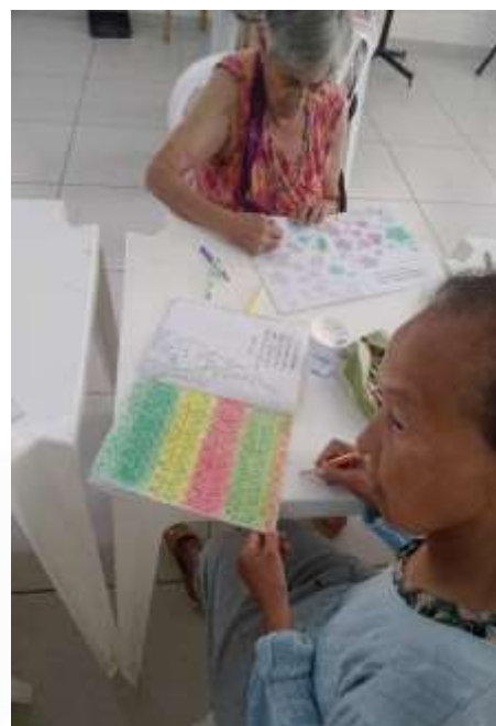
05.03-Quanto mais coloridos, melhor!