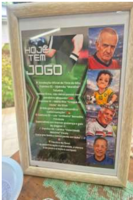
25.02-Com direto a painel temático!!!