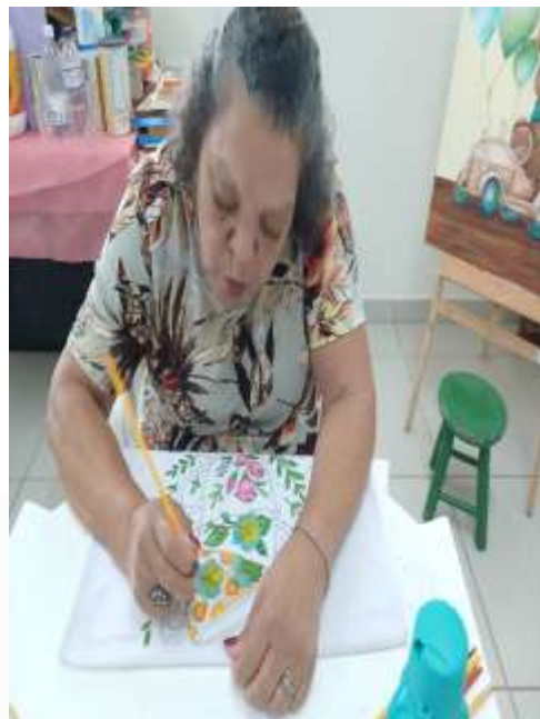
17.04-Gosto pelo que faz