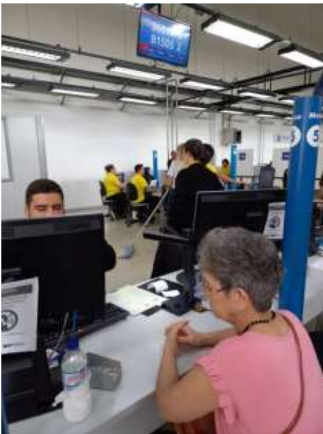
04.03-Atualização de informações