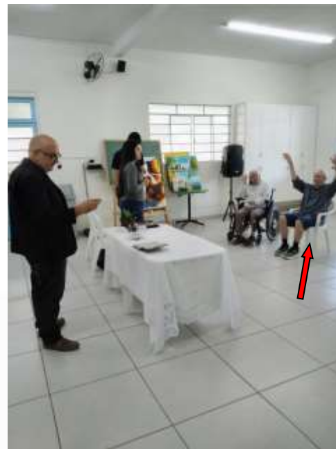
14.03-Idoso louvando o Senhor