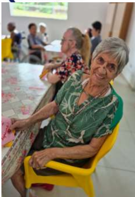
09.03-Se alegrou com o presente