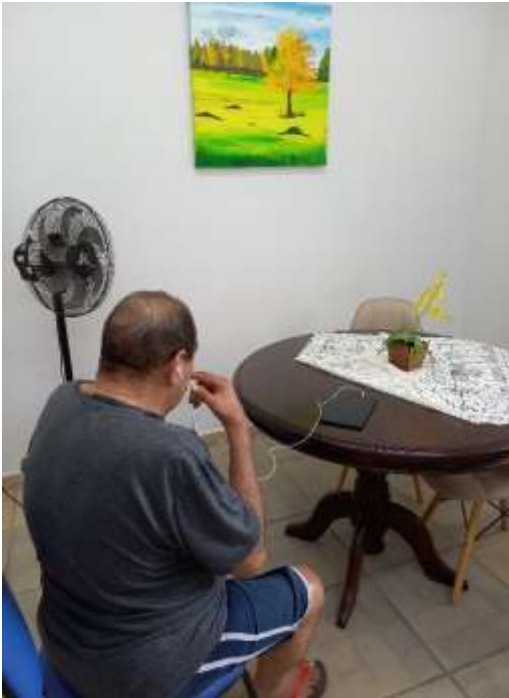
09.03-Telefonando para a irmã