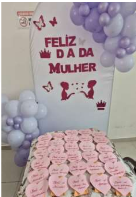
09.03-Mimos feitos com carinho!