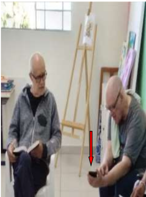
14.03-Leitura on line do texto bíblico