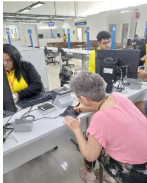
04.03-Cadastro da assinatura