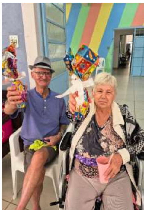
30.03-Páscoa à dois!