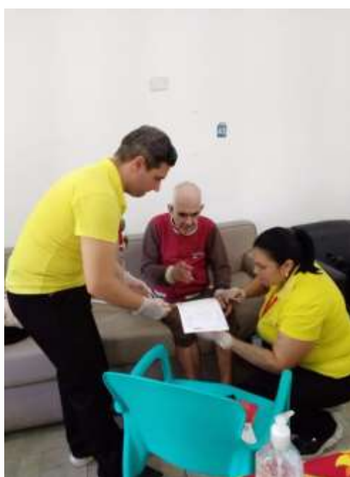
14.03-Atualização importante para todos