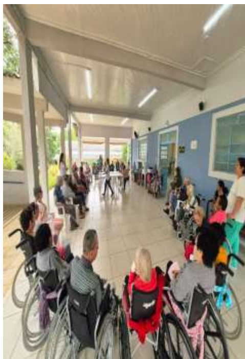
31.03-Passa o coelho