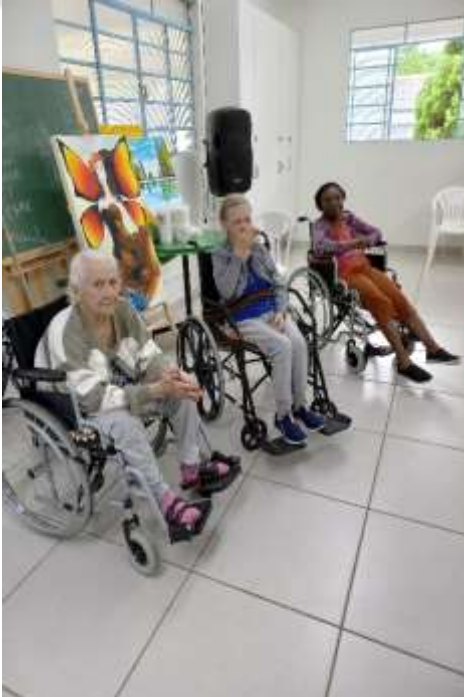
06.03-Aguardando serem atendidas