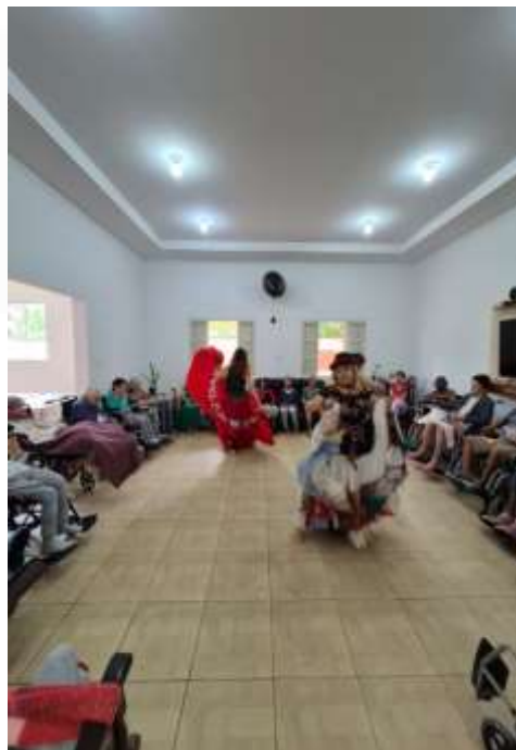
09.03-Apresentação: dança cigana