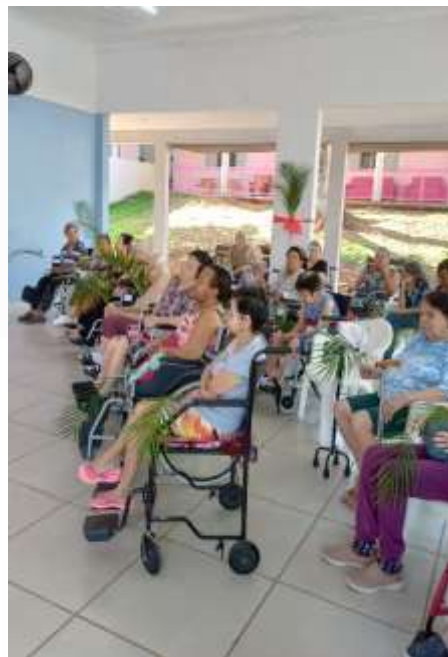
29.03-Idosas participando da celebração