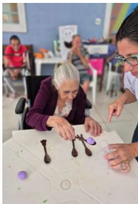
31.03-Passa o ovo!