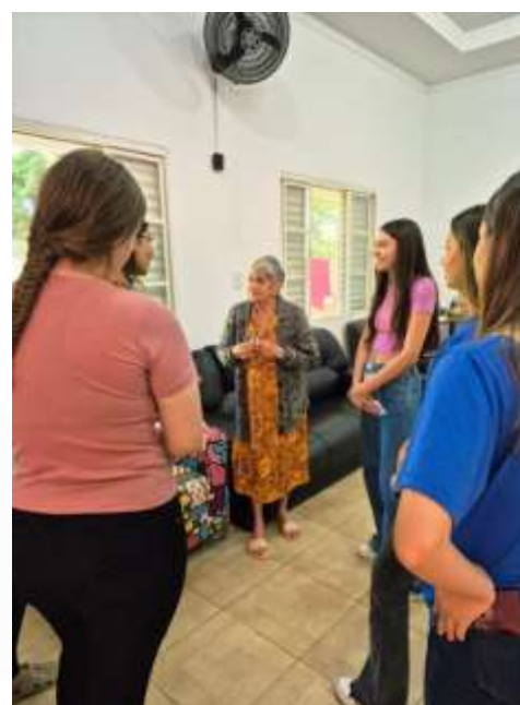
14.03-Visita às idosas no setor