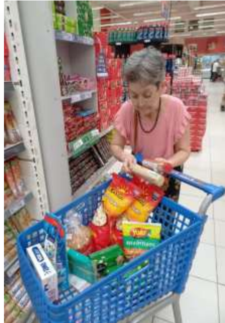
04.03-Guloseimas fazem parte!