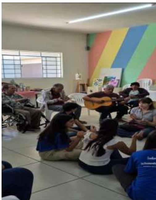
14.03-Interação com música