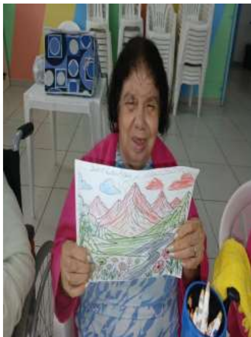
10.04-Orgulhosa com os coloridos