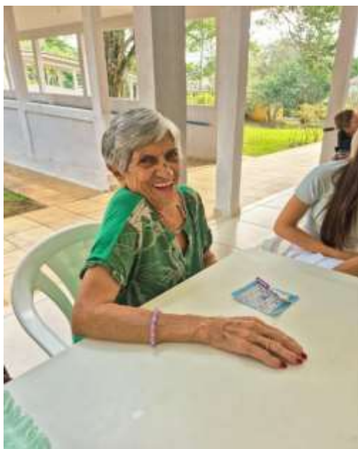
17.03-Ah, vou ganhar!