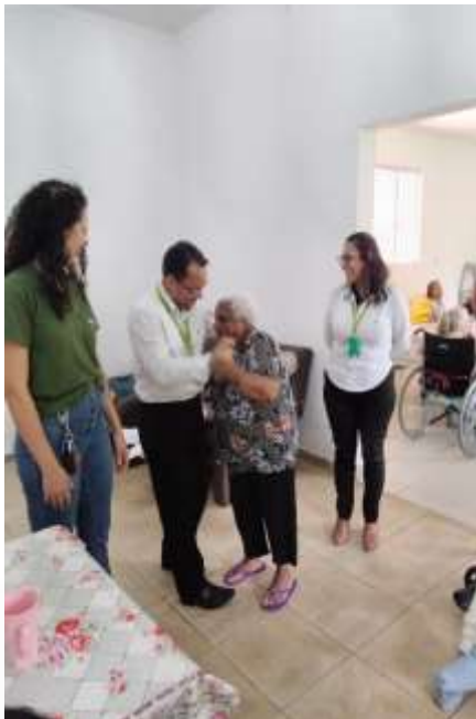
07.01-Visita às idosas