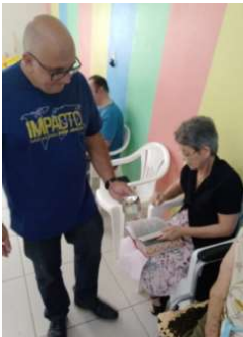
17.01-Oferta do pão