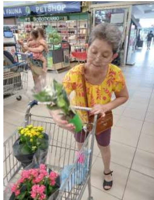
15.01-Flores para decoração