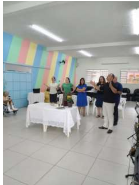
17.01- Iniciando o ano louvando