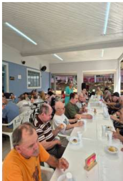
27.01-A grande família em festa!!!