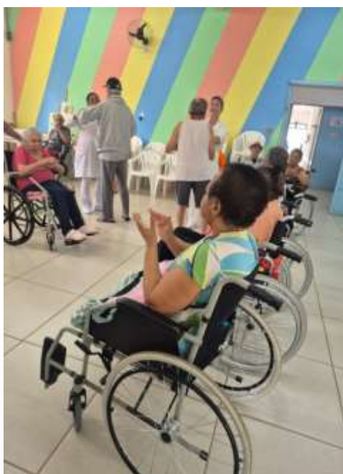
29.01-Bom para interação