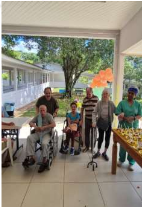
27.01-A festa foi para eles!!!