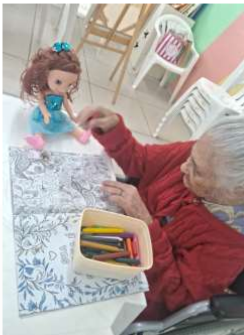
21.01-Pintando com a "amiga" ao lado!