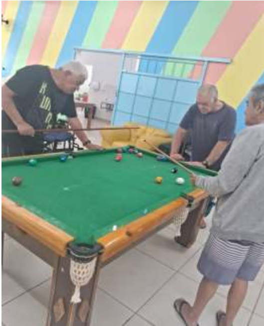
21.02- Se distraindo jogando bilhar