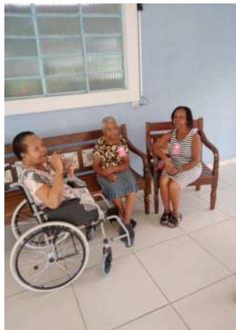
07.01-Recebeu a visita das irmãs