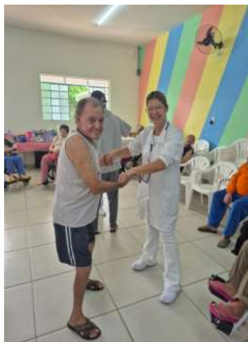
29.01-29.01-Estagiária colaborando na dança