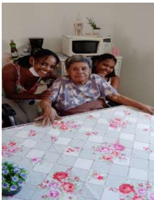
13.01-Filha e neta visitando