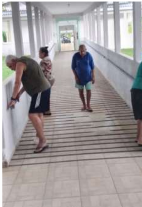
19.01-Exercícios de flexão