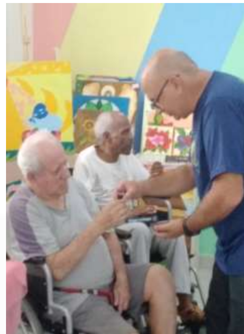
17.01-Oferta do vinho