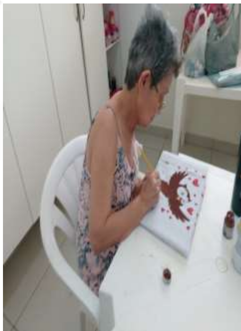
06.01- Corujas do coração!