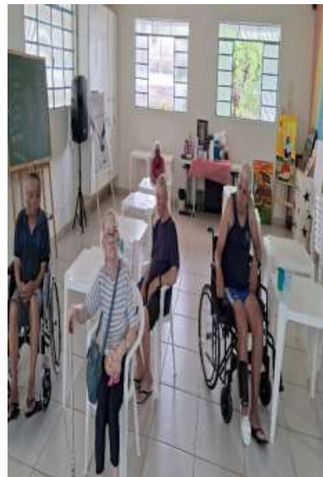
11.01-Uma tarde de domingo com boa distração