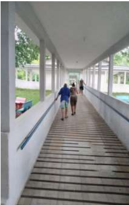
19.01-Caminhada na rampa