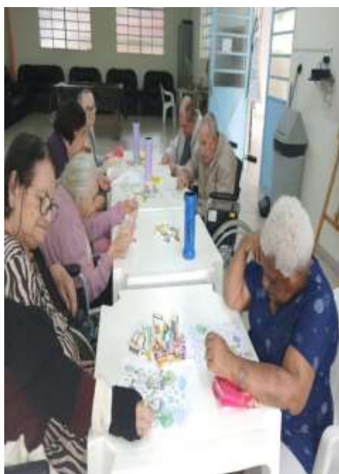
20.01-Cada um expressando seu talento!