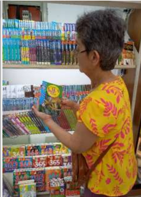
15.01-Exercício para memória