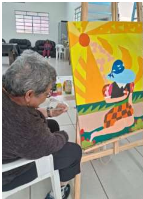
21.01-Toque especial nos detalhes