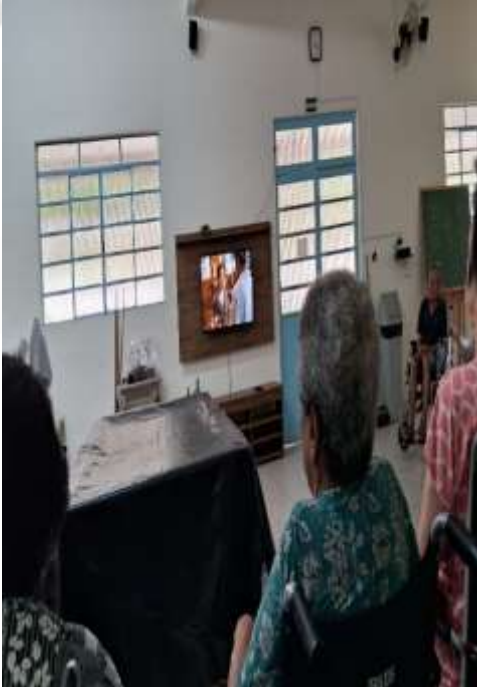
11.01- Filme sugerido: Caramelo

Fundada em 23/03/1902 Reconhecida de Utilidade Pública pelo Município, Estado e União Instituição de Longa Permanência de Idosos CNPJ: 72.308.588/0001-56