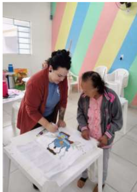
22.01- Exemplo para as novas gerações