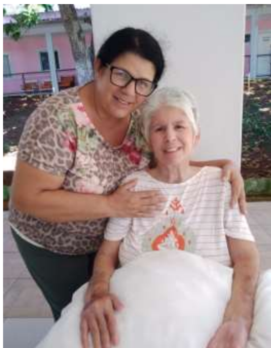
06.01- Alegria: irmã visitando!