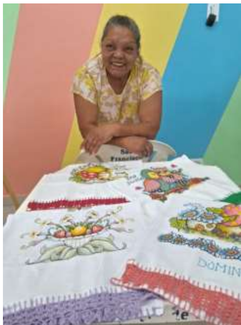
21.01-Crochês feitos por mim