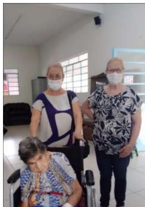
16.01-Minhas amigas visitando!!