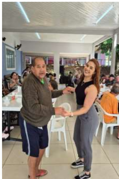
27.01- Olha quem dançou!