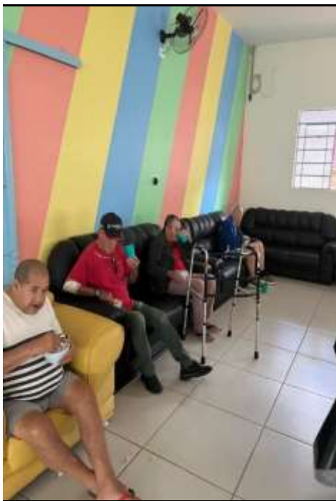
11.01-Cinema com pipoca, hummm!!!