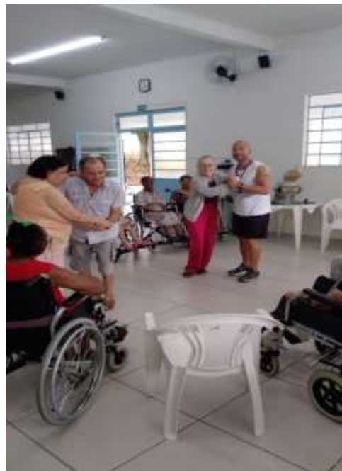
16.01-...bom para mente e o corpo!