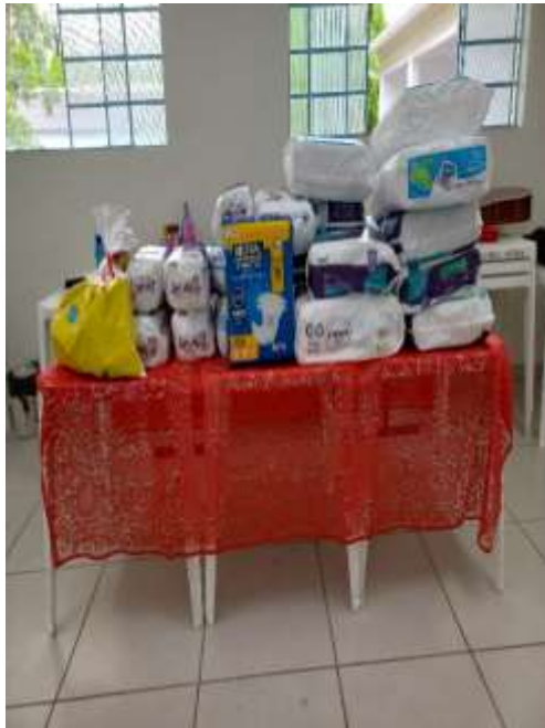
24.01-Doações entregues na C. S Francisco