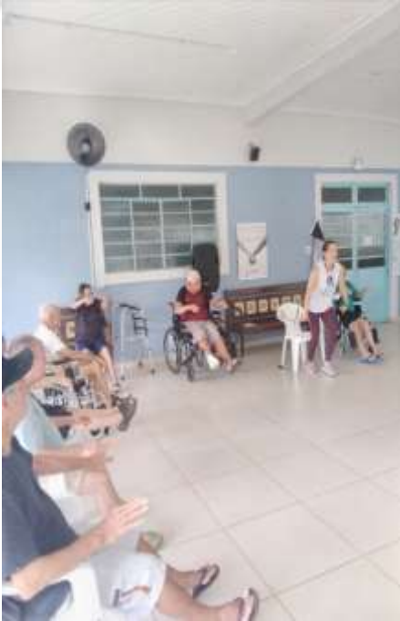
08.01-Demonstrando o exercício