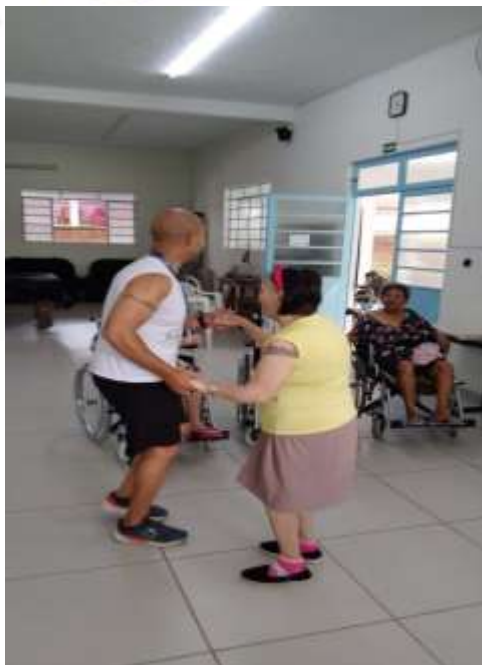
16.01- Dançar faz bem!