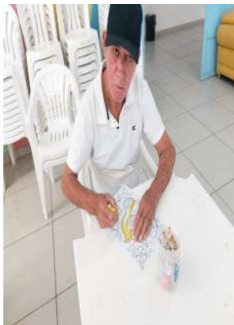
06.01-Coloridos que distraem!