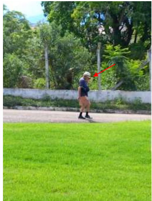
26.01-Chegando do passeio ouvindo aquele som!!!