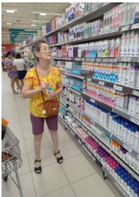
15.01-Se cuidar faz bem!