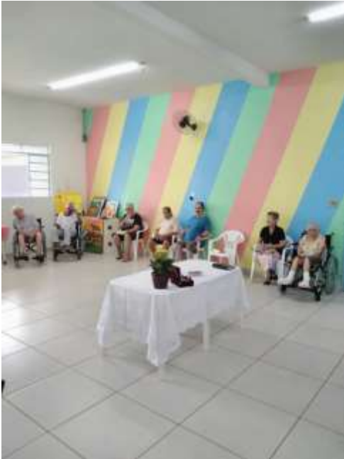
17.01-Idosos reunidos para o culto