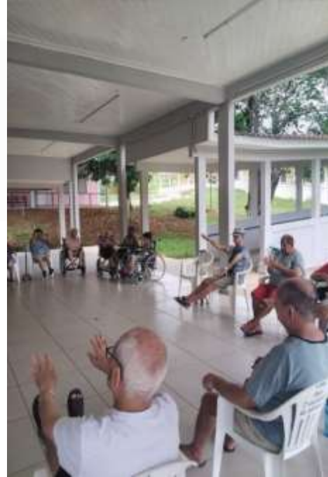
08.01-Alongando braços e pernas