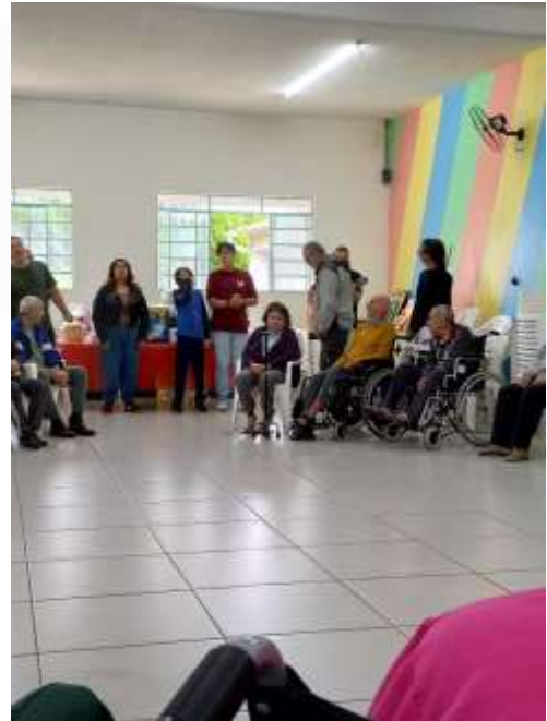
24.01-Manhã de louvor