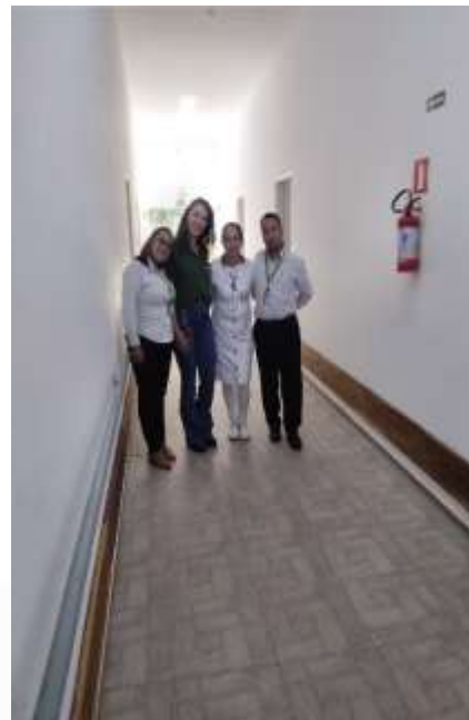
07.01- Recepcionados no setor dos idosos