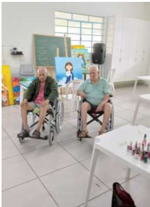
06.02- Idosos aguardando