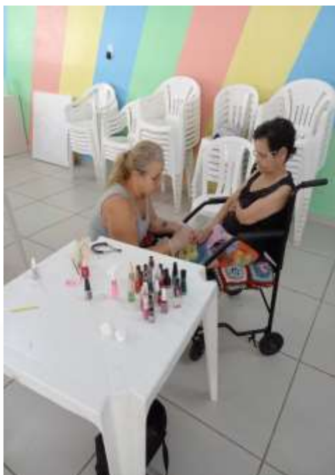
06.02-Idosa sendo atendida