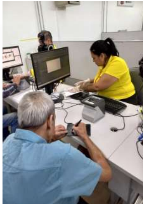
25.02-Poder assinar é importante!