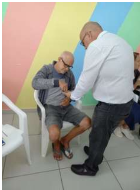
28.02-O mais novo fiel recebendo pão consagrado