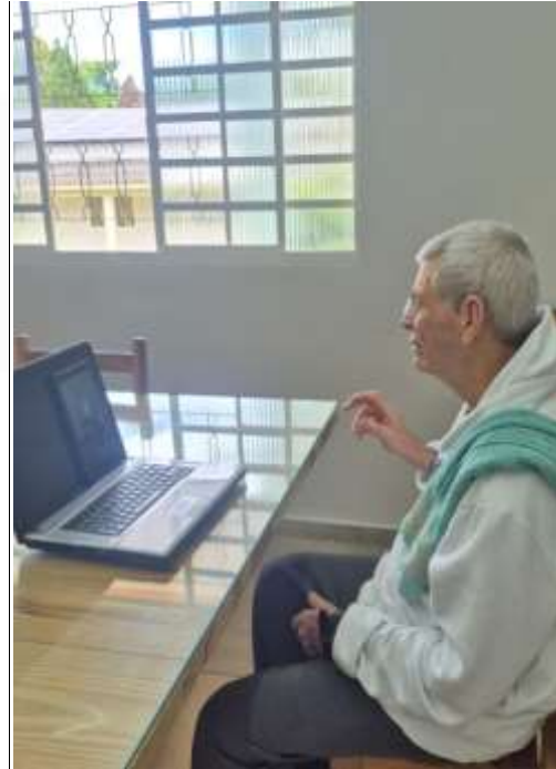
13.02-Interagindo com a sobrinha