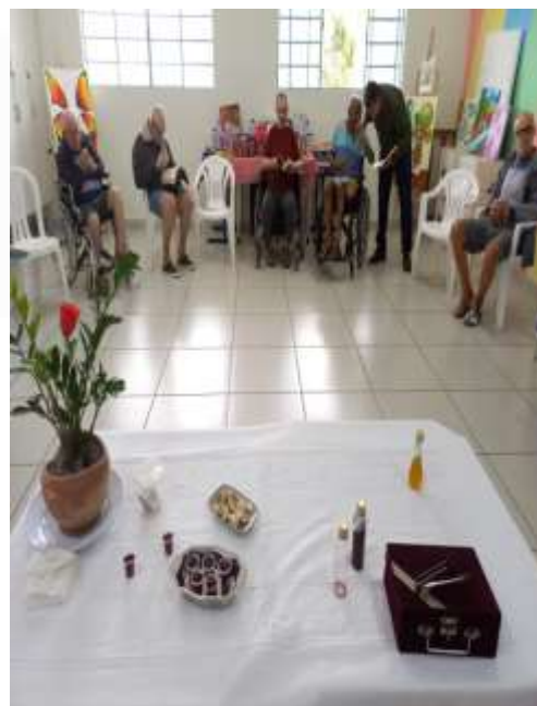
28.02- Pão e vinho para consagração