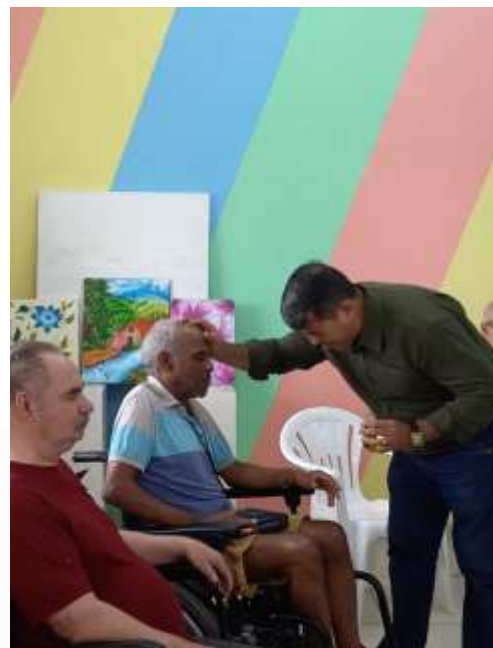
28.02-Unção e oração