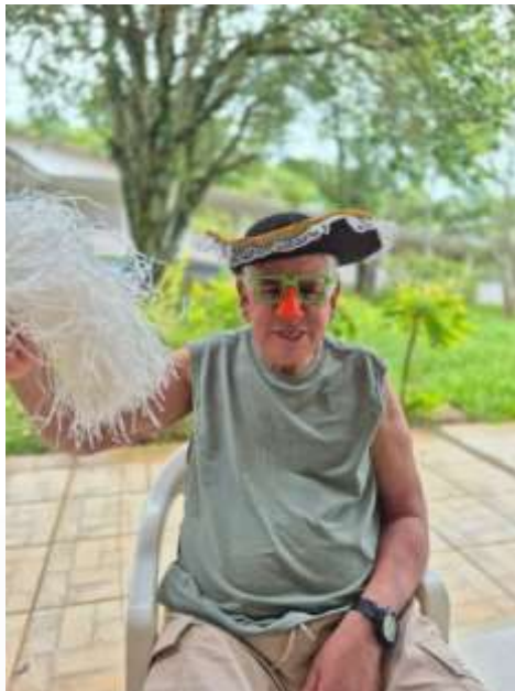
10.02-Carnaval com todos