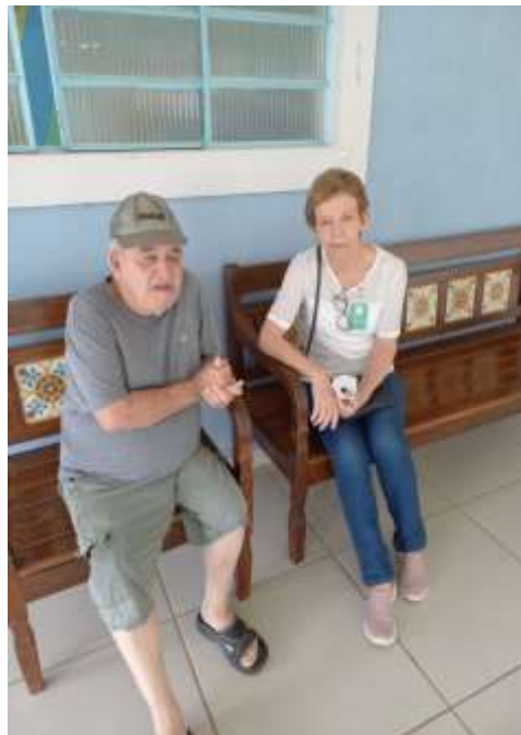
28.02. Prima visitando