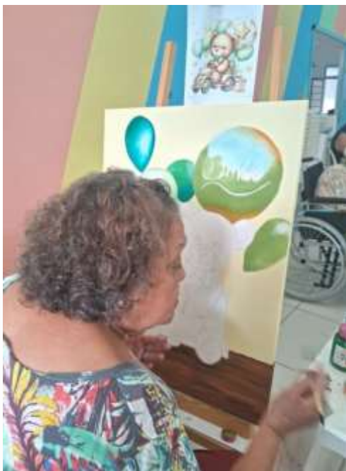
03.02-Aos poucos as formas se definem!