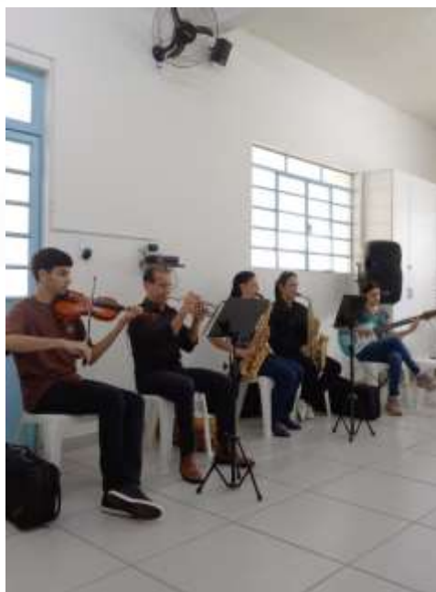
28.02-Hinos para louvor