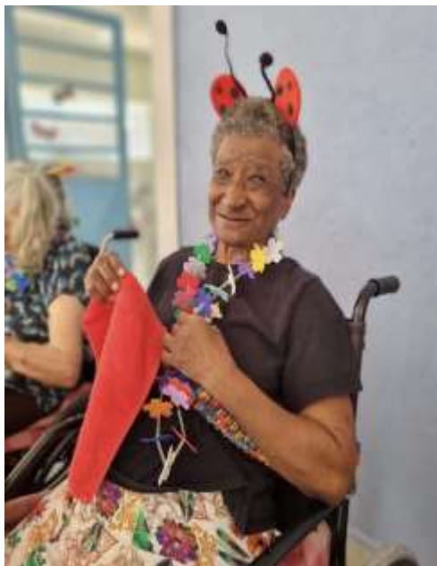
13.02-Joaninhas para a festa