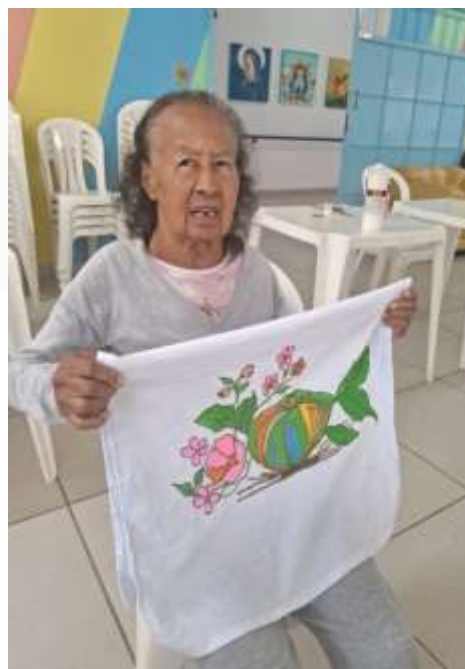
03.02- Exemplo aos 96 anos!