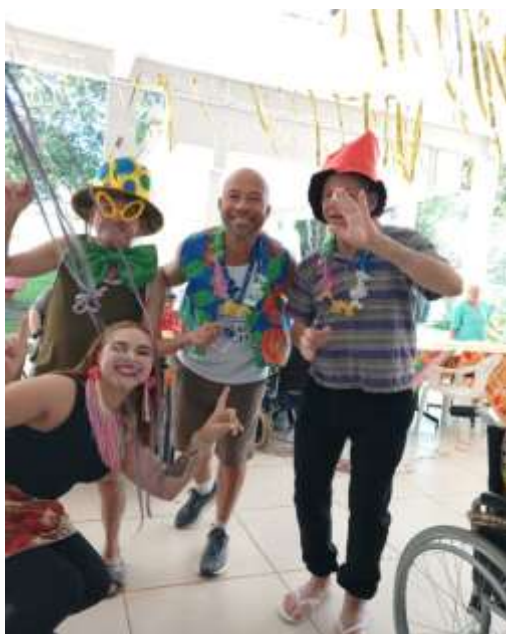
13.02- Foliões animados!!!!