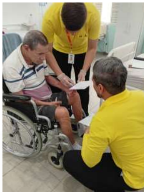
28.02-Respeito e dedicação