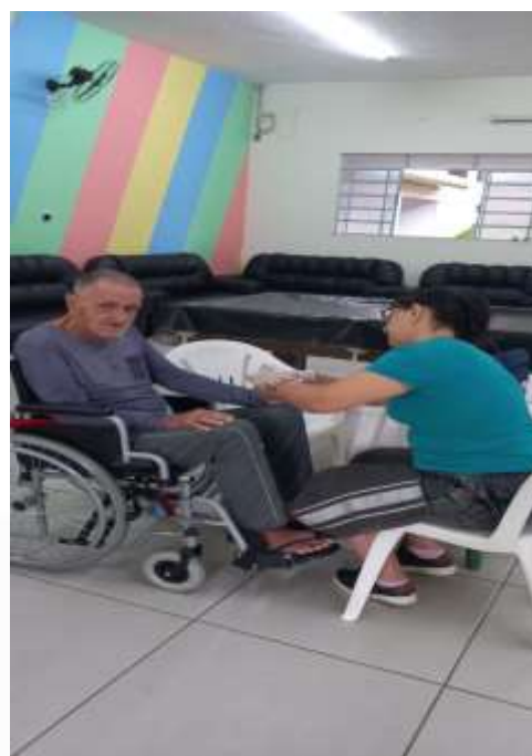
26.02-O mais novo acolhido em atendimento