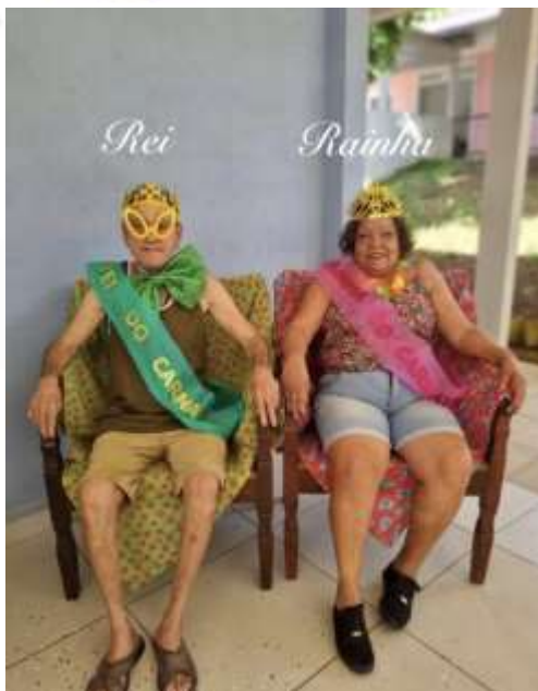
13.02-As realezas do carnaval!