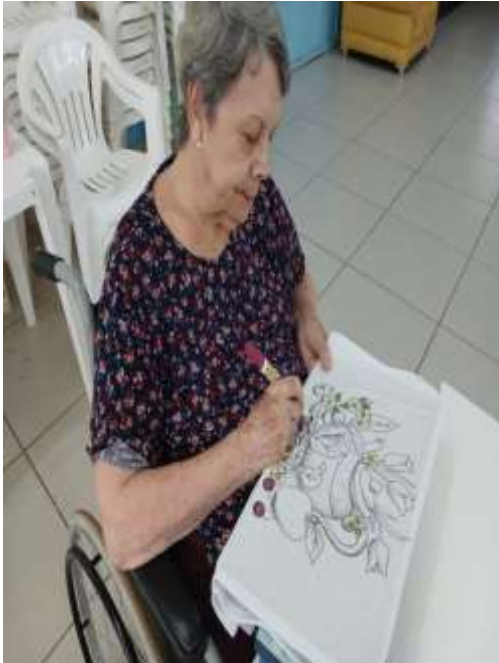
10.02-Gosto pela pintura