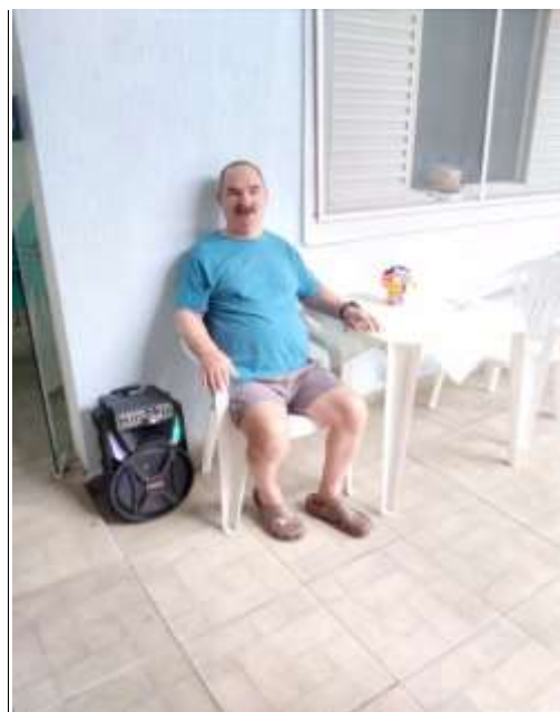
04.02-Curtindo um som!