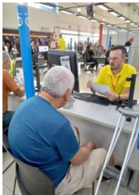
11.02-Confirmação de informações