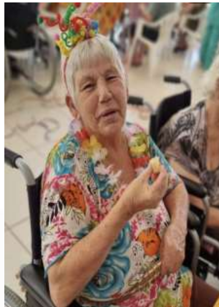
13.02-Festa que alegra!