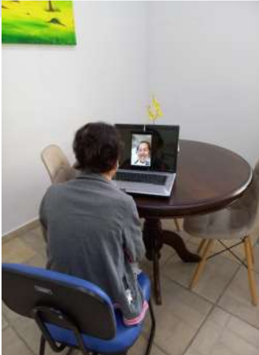
06.02. Interagindo com a irmã

Fundada em 23/03/1902 Reconhecida de Utilidade Pública pelo Município, Estado e União Instituição de Longa Permanência de Idosos CNPJ: 72.308.588/0001-56