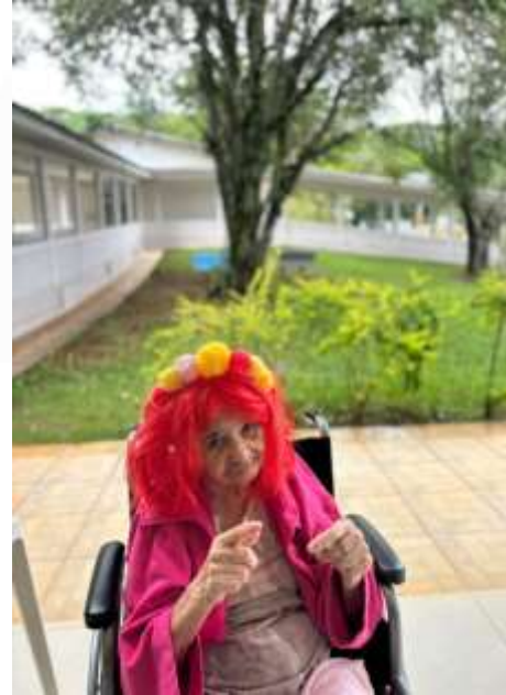
10.02-Irei de ruiva!