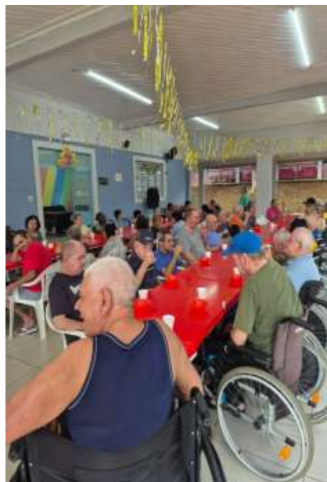
25.02-Realmente uma grande família!!