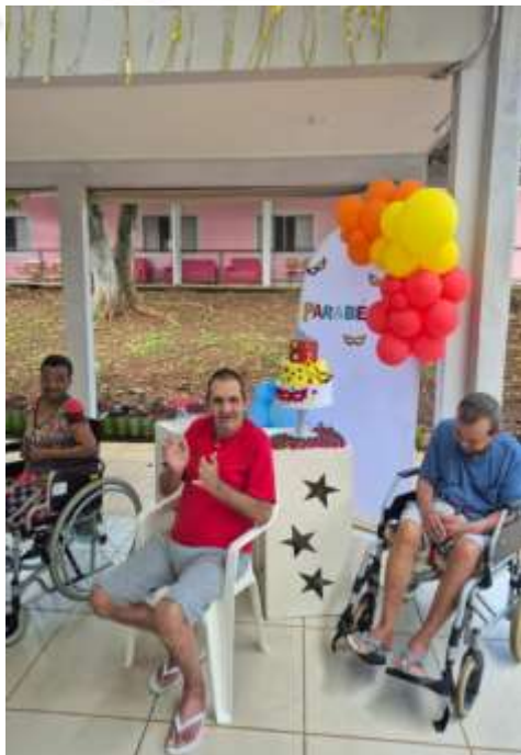
25.02-Comemorei meu aniversário