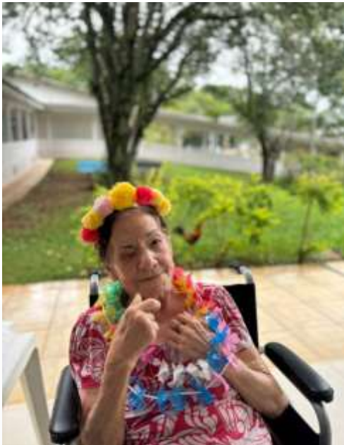
10.02-Para relembrar bons tempos!