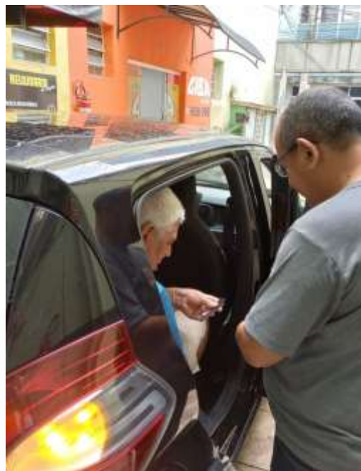
11.02-Levou o relógio para conserto