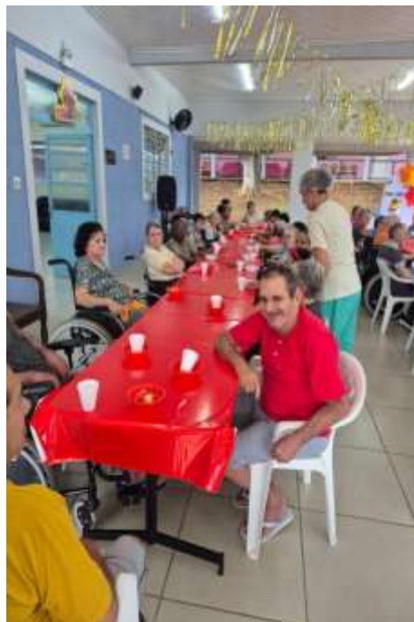
25.02-Se alegrou com a festa