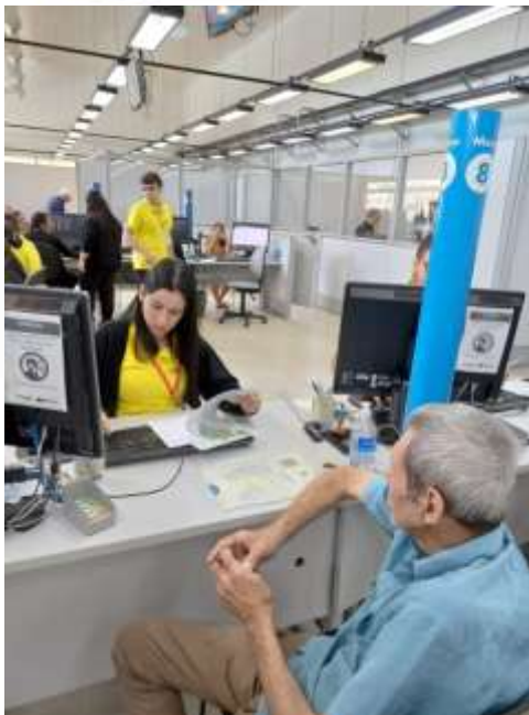
25.02- Atualizando e confirmando informações