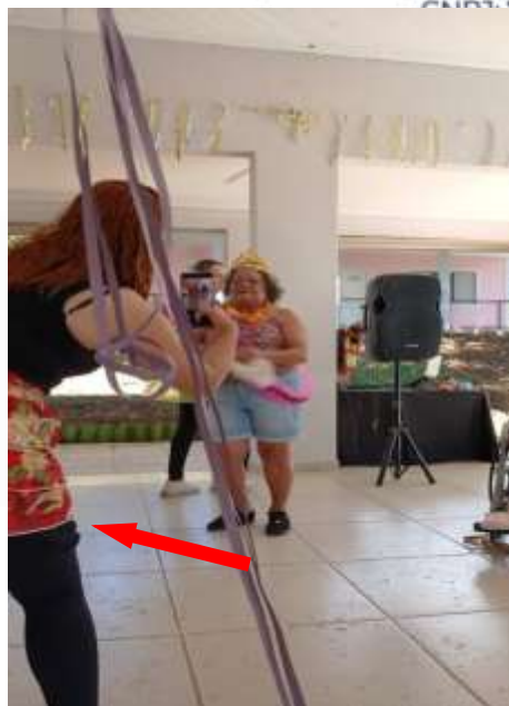
13.02-Paparazzis em cena!