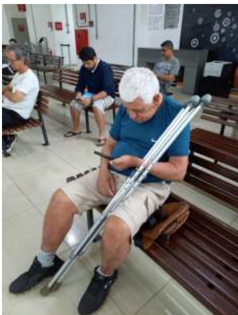
11.02- Aguardando atendimento.