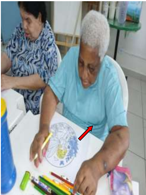
24.02-Flores azuis para combinar