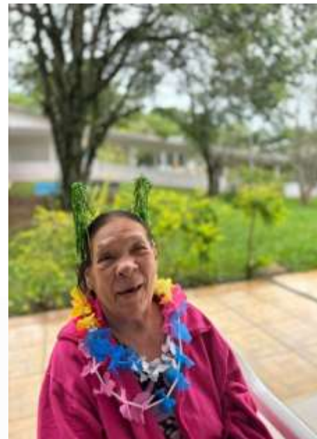
10.02-Festas que alegra!