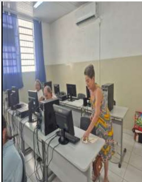
20.02-Idosos no curso de informática!