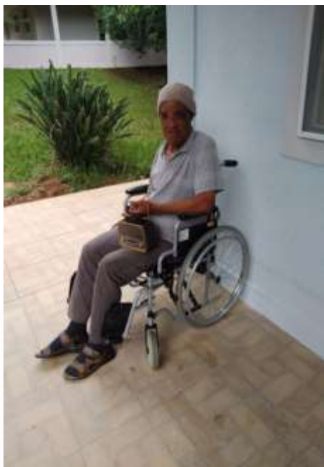
04.02-Rádio companheiro inseparável!