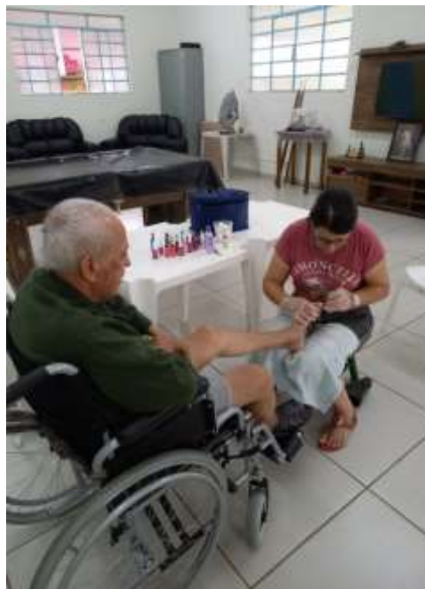
06.02-Idoso sendo atendido