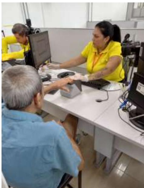
25.02-Biometria das digitais