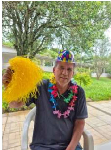
10.02- Minha fantasia!