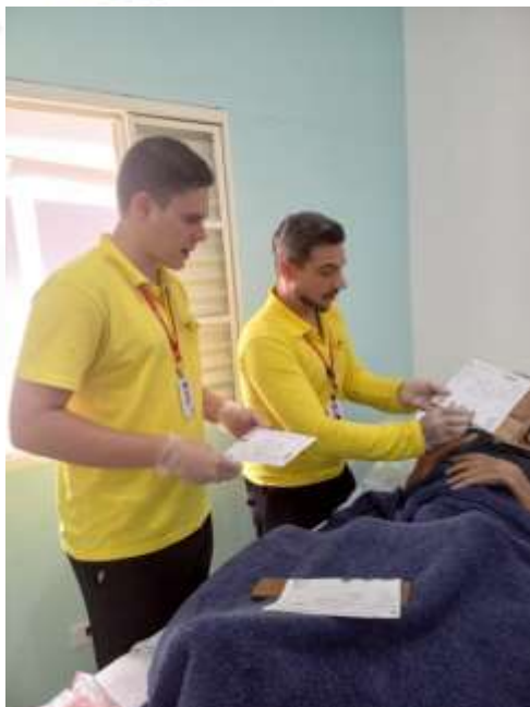
28.02-Coleta das digitais