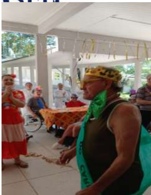
13.02-O rei caiu na folia!!!!