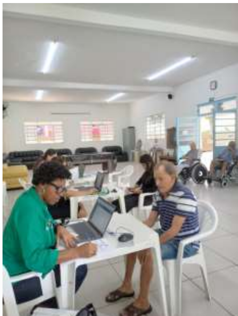
23.02-Atualização presencial e participativa