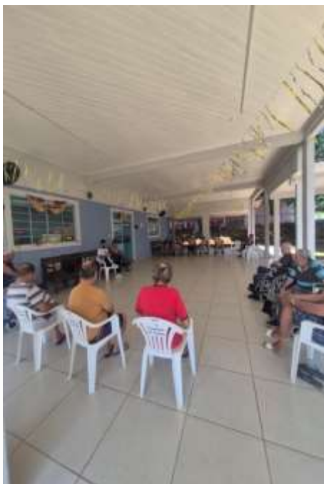
19.02-Exercícios para as pernas