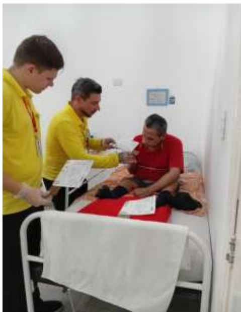
28.02-Sem limites para atualizações